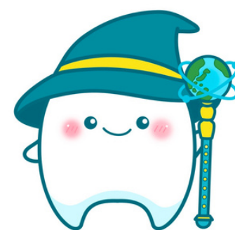
公式マスコットキャラクター ポノちゃん